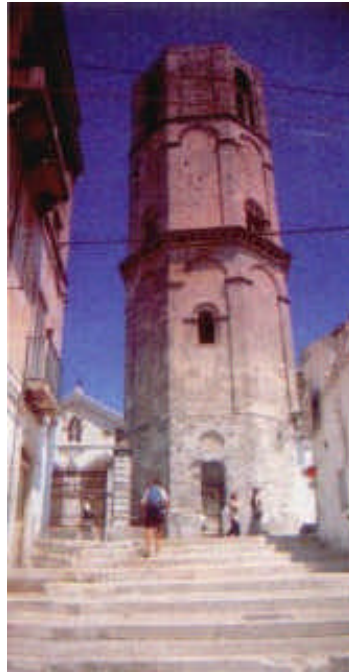
Monte S. Angelo: in cammino verso il Santuario di S.Michele

E qui, prima di entrare nella grotta, ci viene (purtroppo!) imposto di non eseguire né riprese fotografiche né video. Rispettiamo a malincuore questo divieto, ma più che altro per l'accortezza da noi mostrata nei riguardi di quei pellegrini e quei devoti giunti fin qui a pregare il Santo e la sua sacra dimora. Quindi, non avendo alcuna immagine dell'interno della Grotta descriviamo brevemente come appaiono gli ambienti. Varca-