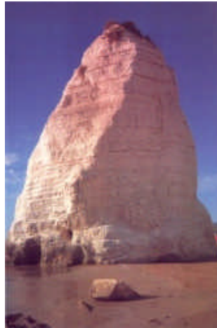
Il monolito calcareo dello scoglio detto "Pizzomunno" sulla spiaggia, proprio sotto l'abitato di Vieste

La prima suggestione che si coglie è quella di un bianco promontorio che va a bagnarsi in un mare dagli incontaminati colori e dalle cristalline trasparenze dei fondali. Questo è il "biglietto" di presentazione del Gargano, 65 km di costa, per una larghezza di 40 km (il suo punto più elevato è il monte Calvo - 1055 m) che si protendono nell'Adriatico e che si alternano tra basse, sabbiose e bianche spiagge e precipiti scogliere ricoperte dalla macchia mediterranea. Ambienti selvaggi e ancora inviolati nascondono culture millenarie le cui memorie si perdono nel tempo, in un mondo senza confini. Lo "Sperone d'Italia" è un ammasso calcareo ove il carsismo, col suo lento e incessante lavoro, ha lasciato qui incisi i suoi segni più profondi. Terra arida, ingentilita dalla presenza endemica del pino d'Aleppo che con le sue frondose chiome impreziosisce un aspro ambiente costellato da grotte, doline e inghiottitoi. Pinete, agrumeti, uliveti e frutteti, distribuiti nelle valli o lungo i suoi promontori, rendono più dolce la fisionomia delle pietrose pendici. Con le sue pareti a picco, la costa avanza tra promontori ricchi di macchia e ginestre e le "calenelle" (piccoli arenili); lunghe spiagge vengono intervallate da caverne,