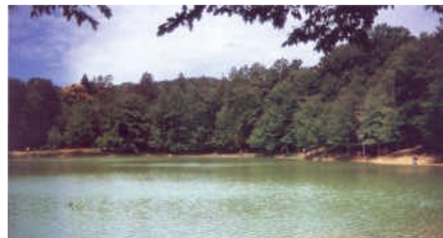
Un laghetto nel cuore della foresta Umbra

Si continua proseguendo lungo lo stradello principale che attraversa faggete e pinete emergenti da un fitto sottobosco formato da mirti, ginepro ed eriche. E così dopo aver tralasciato sulla sinistra (787m) la deviazione che porta giù alla Caserma